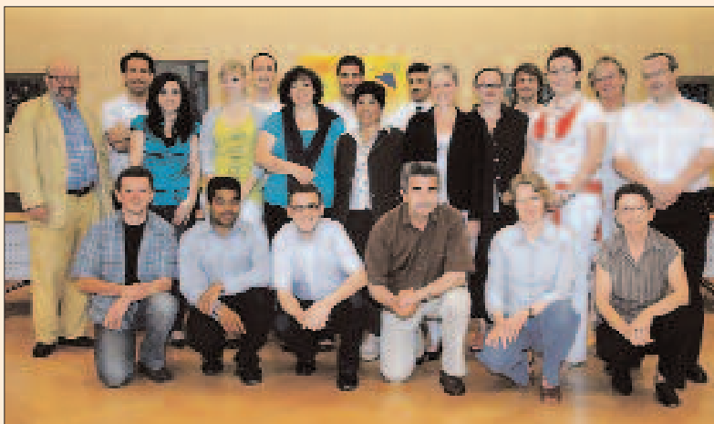
Der Kreuzlinger Ausländerbeirat.

Die AGK legt Wert darauf, der ausländischen Bevölkerung zu ermöglichen, ihre Bedürfnisse in allen wichtigen Lebensbereichen zu formulieren. Dabei ist die AGK ein Verein, dem jeder jederzeit beitreten kann. cp